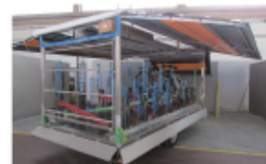
Ante apribili a mezzo molle gas - struttura sfruttabile per uso gazebo per messa a punto bici