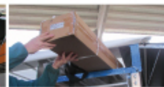
Vano portapacchi, ricambi e accessori