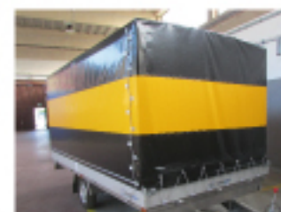
Centinatura speciale in alluminio con telo PVC personalizzabile 650gr/mq