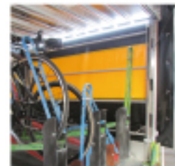
Luci interne a led