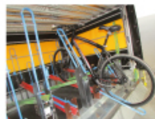
Trasporta 14 Bici